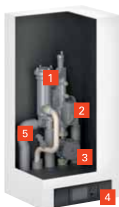
VITOCAL 200-A Inneneinheit

Im Zuge einer Modernisierung ist die Wärmepumpe gut für den bivalenten Betrieb geeignet. In diesem Fall bleibt die bestehende Anlage zur Abdeckung von Spitzenlasten bei besonders niedrigen Temperaturen weiterhin im Einsatz. Damit wird die Effizienz der Anlage erheblich gesteigert.